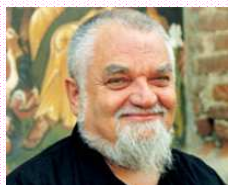
Articolo di Enzo Bianchi Fondatore della comunità monastica di Bose

Un tempo nel rito dell'imposizione delle ceneri si ricordava al cristiano la sua condizione di uomo tratto dalla terra e che alla terra ritorna, secondo la parola del Signore detta ad Adamo peccatore. Oggi il rito si è arricchito di significato, infatti la parola che accompagna il gesto può anche essere l'invito fatto dal Battista e da Gesù stesso all'inizio della loro predicazione: «Convertitevi e credete all'Evangelo»... Ricevere le ceneri significa prendere coscienza che il fuoco dell'amore di Dio consuma il nostro peccato; accogliere le ceneri nelle nostre mani significa percepire che il peso dei nostri peccati, consumati dalla misericordia di Dio, è "poco peso"; guardare quelle ceneri significa riconfermare la nostra fede pasquale: saremo cenere, ma destinata alla resurrezione.